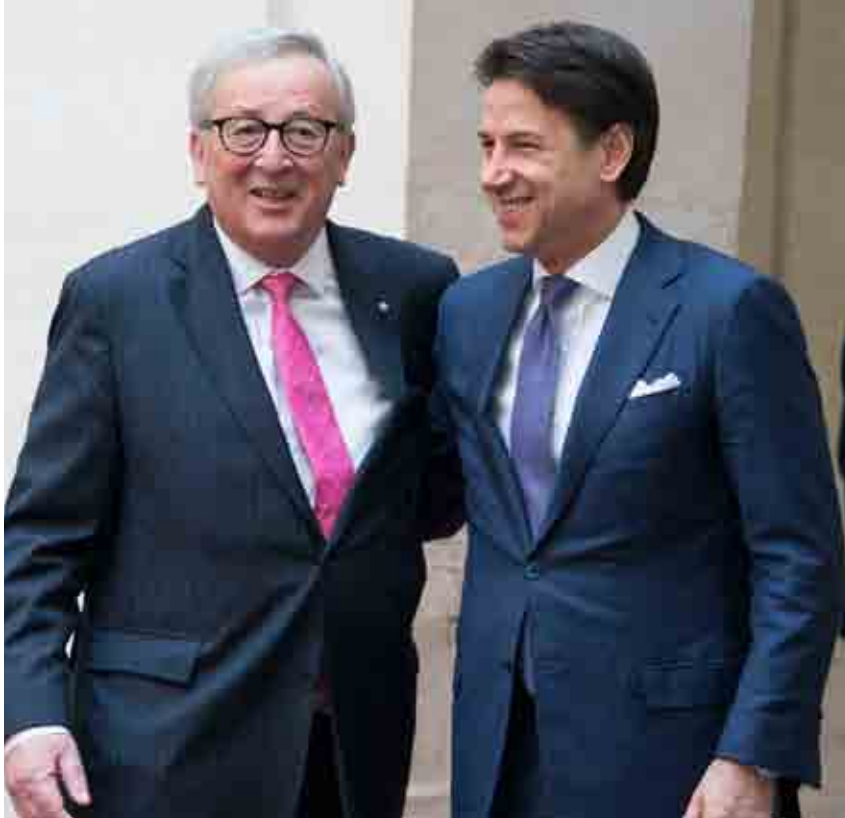
Juncker e Conte a Bruxelles il 2 aprile scorso