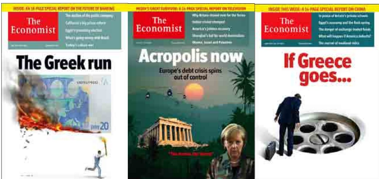
La Grecia delle copertine dell'Economist

"Rivendicare i debiti di guerra dalla Germania è un dovere storico ed etico per la Grecia", ha detto il primo ministro ellenico Alexis Tsipras, spiegando che la richiesta di risarcimenti sarà spedita nei prossimi giorni a Berlino e includerà, tra le altre cose, le riparazioni per la distruzione materiale e lo smantellamento delle capacità produttive del Paese, i risarcimenti per i parenti delle vittime e il recupero dei tesori archeologici rubati e del prestito forzoso del 1942 (imposto dai nazisti all'allora