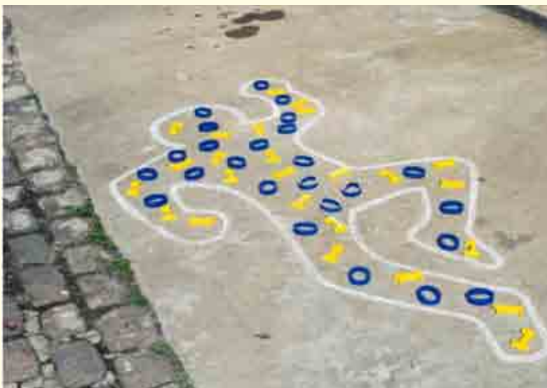
Scena del crimine

9/15, in attuazione delle disposizioni della direttiva 2011/99/UE del Parlamento Europeo e del Consiglio sul << riconoscimento reciproco degli effetti delle misure di protezione adottate da autorità giurisdizionali degli Stati membri, nei limiti in cui tali disposizioni non si pongano in contrasto con i principi supremi dell'ordinamento costituzionale in tema di diritti fondamentali, di libertà e di giusto processo>> .