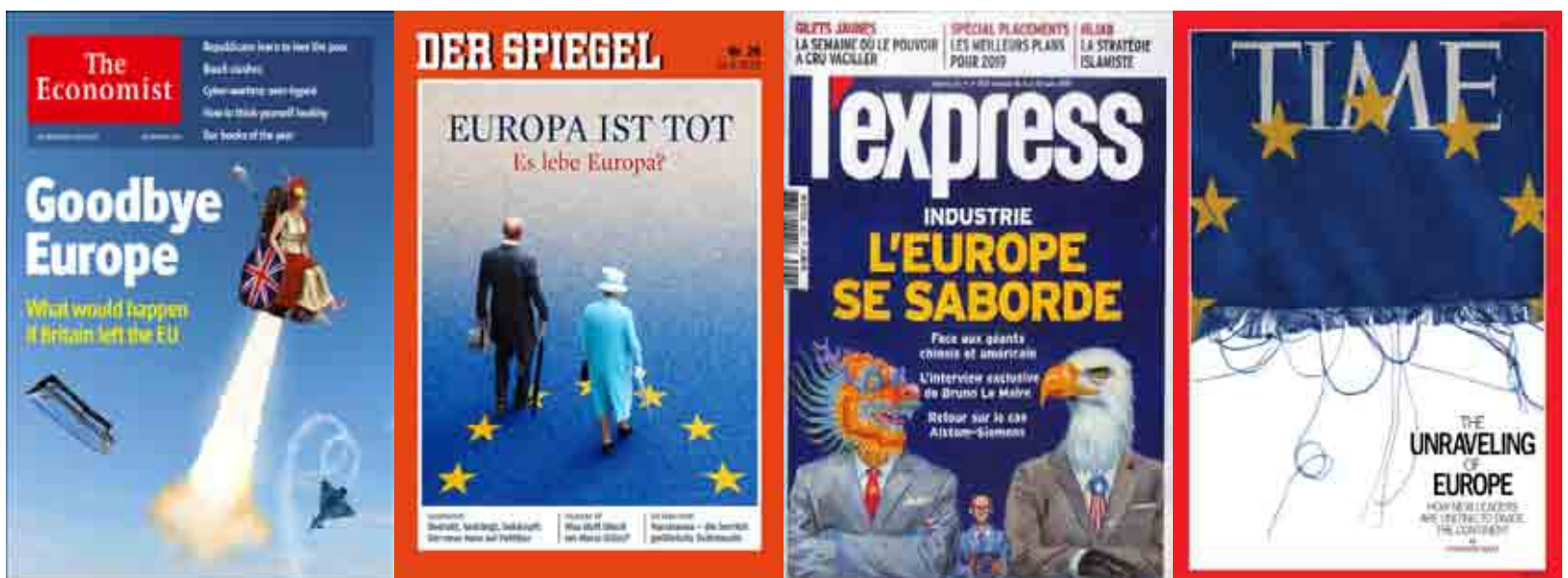
Il caso Europa nei periodici europei