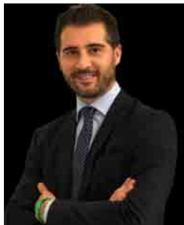
LEGA – SALVINI PREMIER

6) Il Parlamento ha votato la riforma del Trattato di Dublino, che affronta il problema dei migranti, ma questa riforma non è operativa. Come giudica la riforma, e come mai c'è questa impasse?