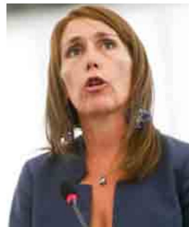
MoVimento 5 STELLE