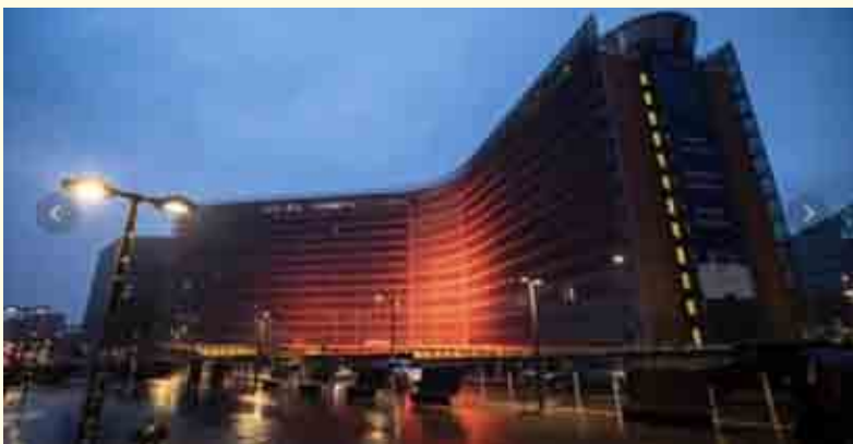
La Commissione Europea, a Bruxelles

Le decisioni su proroga, riesame, modifica, annullamento, sostituzione della misura di protezione